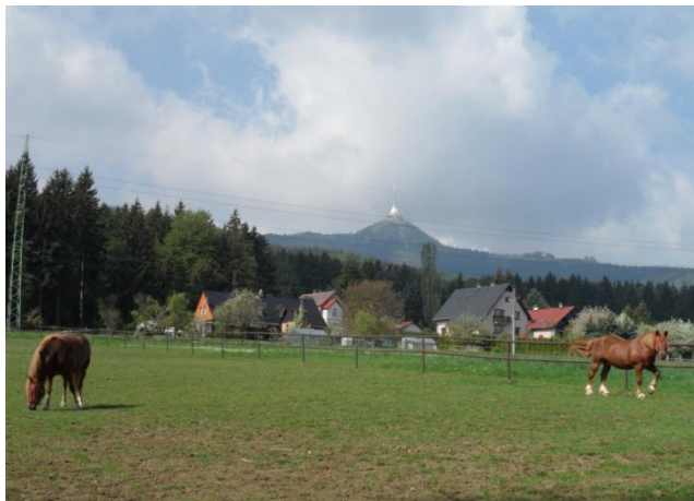
Koně Dan a Basia pasoucí se pod dominantou města Liberce.

Lukey kříženec ČT x český sportovní pony, narozen 2006, ve vlastnictví OS Svítání od 23. 4. 2011