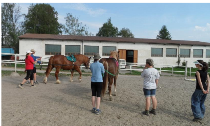
Probíhající výcvik studentů v přípravě koní pro hiporehabilitaci.

Dalším z poslání OS Svítání je podpora vzdělávání v hiporehabilitaci pro pracovníky v hiporehabilitaci, zdravotníky, chovatele koní a širokou veřejnost. OS Svítání je od roku 2003 jedním ze šesti Středisek praktické výuky vybraným podle kritérií České hiporehabilitační společnosti. V loňském roce jsme se soustředili na předávání našich zkušeností formou intenzivních týdenních odborných praxí pro širokou veřejnost.